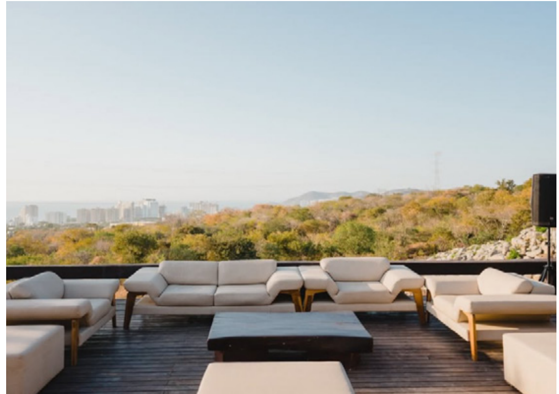
Salas Lounge Beige