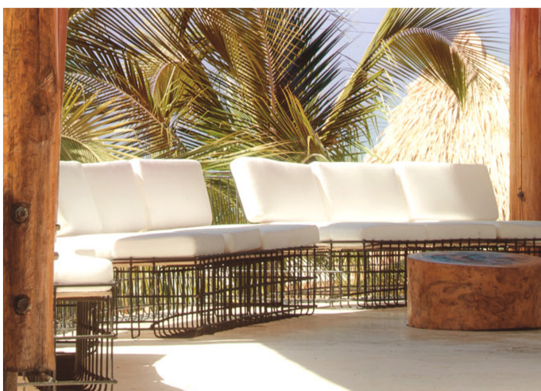
Sofás de hierro