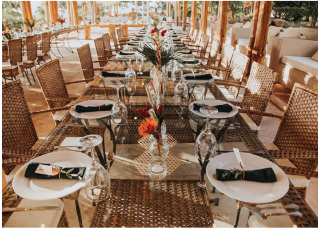
Mesa de vidrio y ratán (Sillas de Ratán)