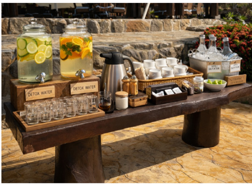
Tablones de madera rústica