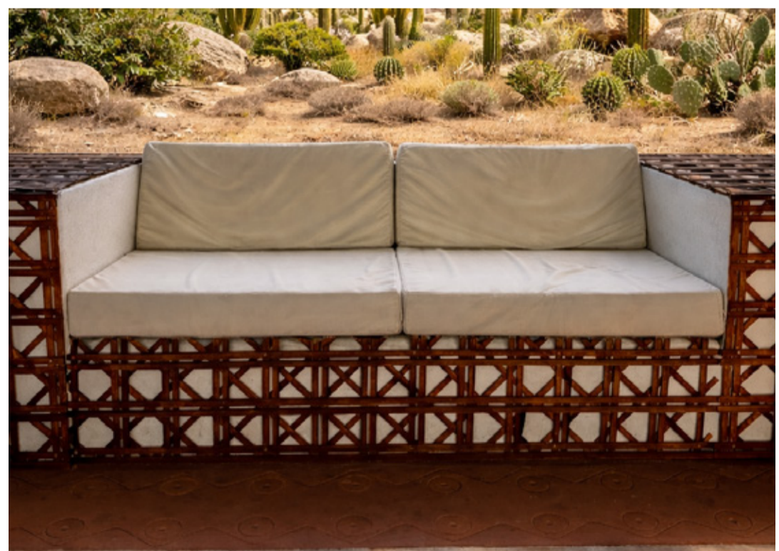
Sofás de mampostería

Conoce el Plano Mamancana y el mobiliario disponible