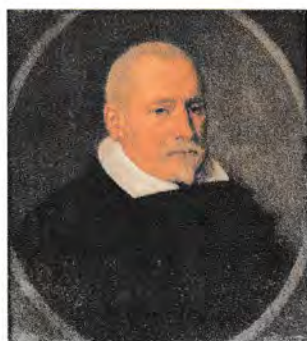
Gijsbert van Diemerbroeck.

Begin 2024 verrijkte het museum zijn collectie met een unieke aanwinst: Een 17e-eeuws schilderij van burgemeester Gijsbert van Diemerbroeck, dat nu te bewonderen is in de burgemeesterskamer in het stadskantoor.