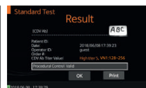
[Título Bajo (5)]