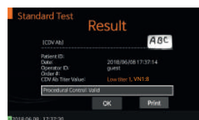
[Título Bajo (1)]