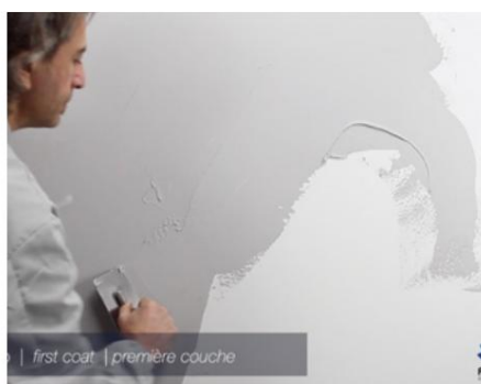
Primul strat Materix 3.5