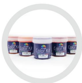
Kit de culori