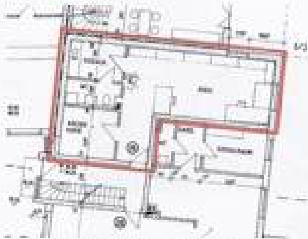
Grundriss Erdgeschoss mit Sonderzugang Nr. 18