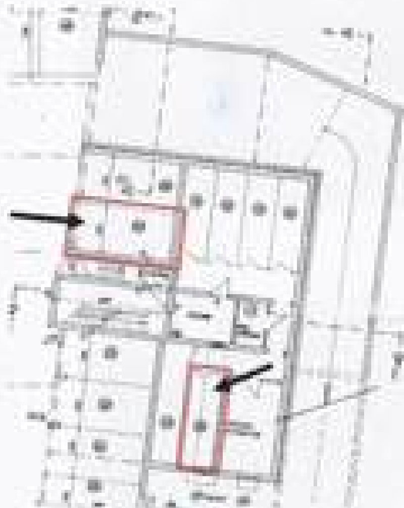
Grundriss Kellergeschoss mit Kellerabfall Nr. 19 und TG-Stützplatte Nr. 20