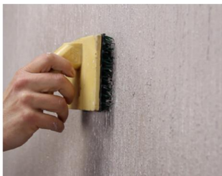
Zgârieturi Seduxion al doilea strat