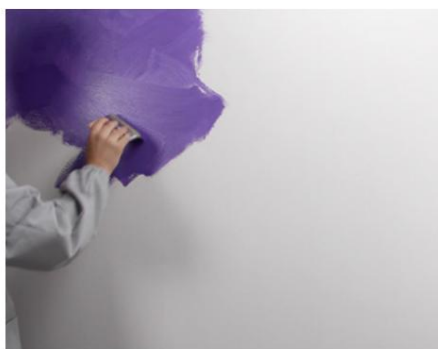
Primul strat Seduxion