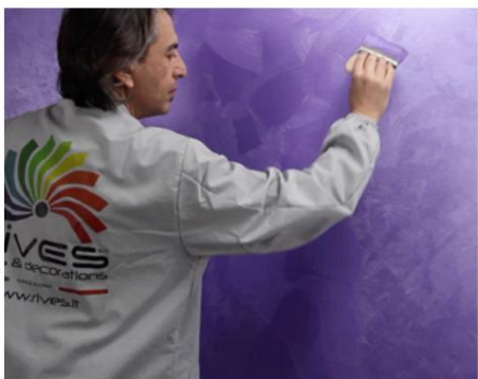
Al doilea strat de Seduxion