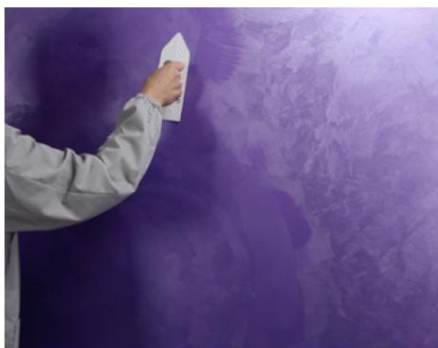
Netezire al doilea strat cu mistrie de plastic