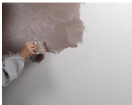
Seduxion prima culoare