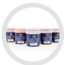
Kit de culori