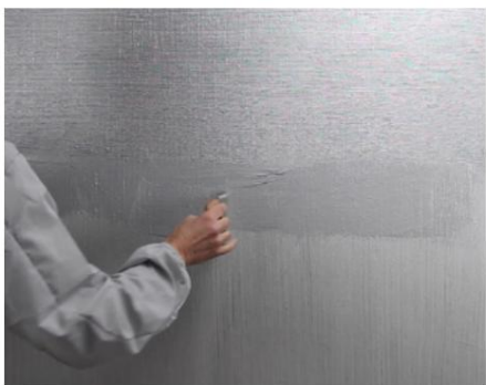
Al doilea strat de Seduxion