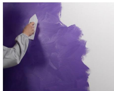
Netezirea primului strat cu o mistrie din plastic