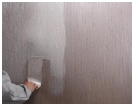
Seduxion a doua culoare