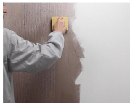
Primul strat de Seduxion pentru zgârieturi