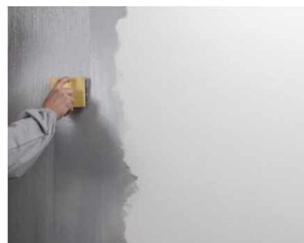
Linii verticale de zgârietură Seduxion