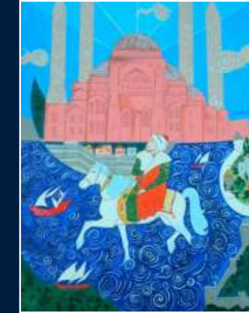
2 Gülnihal Saraç - Konya