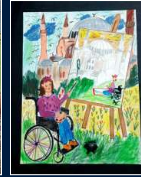
2 Simay Özen - İzmir