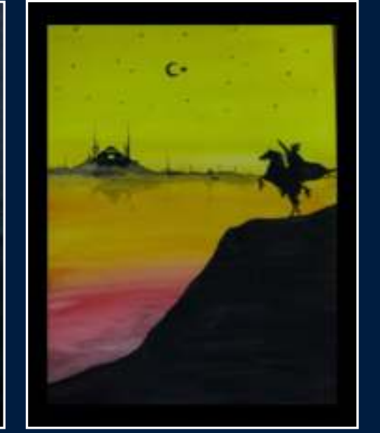
3 Merve Şen - Nevşehir

Dereceye giren 3 liseli arkadaşımız ve eserleri: