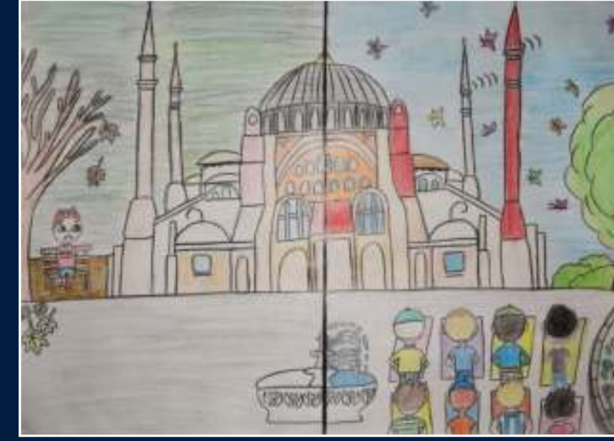
1 Zeynep Güden - Malatya

Dereceye giren 3 ortaokullu arkadaşımız ve eserleri: