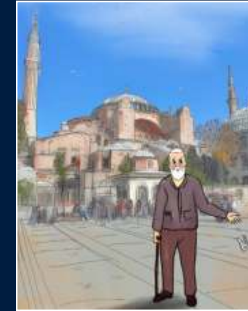
1 Nefise Selen Derya - Ankara

Dereceye giren 3 liseli arkadaşımız ve eserleri: