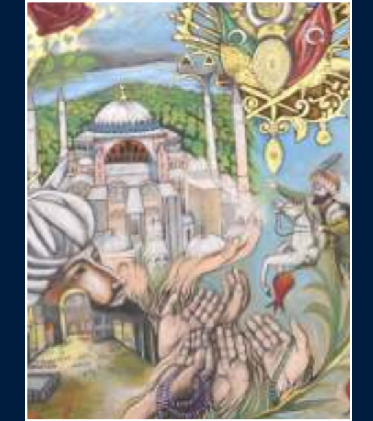
3 Alime Melike Koyuncu - Çankırı