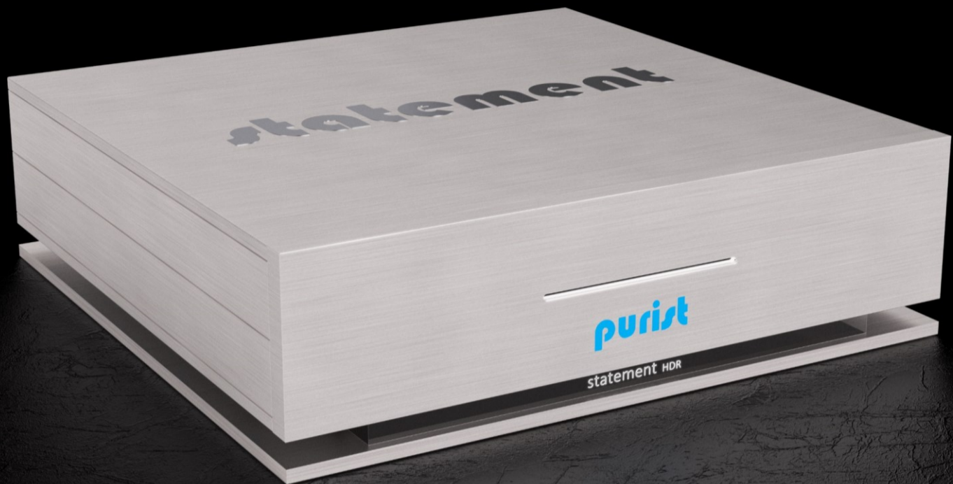
Abbildung: statement HDR mit Base (Option)

Die perfekte Synthese aus Komfort, Klang, Qualität, Ästhetik und Haptik. 100% geräuschlos. 5 Jahre Garantie*