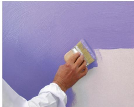
Strălucire primul strat cu pensula