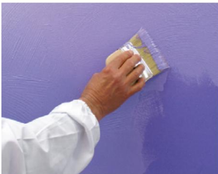
Strălucire al doilea strat cu pensula