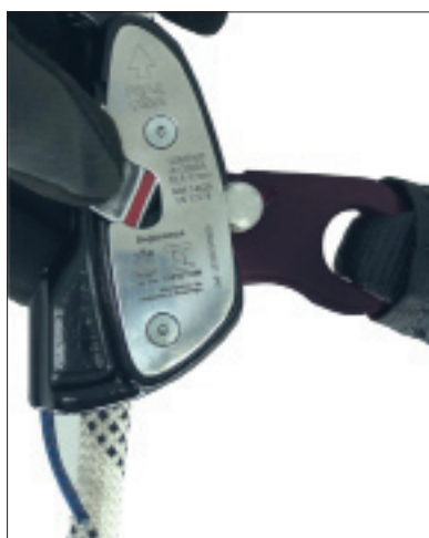
Sinalizador de trava aberta