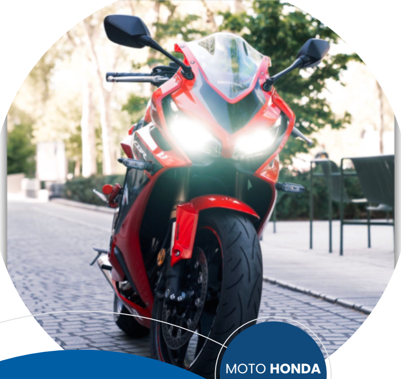
MOTO HONDA CBR-650R