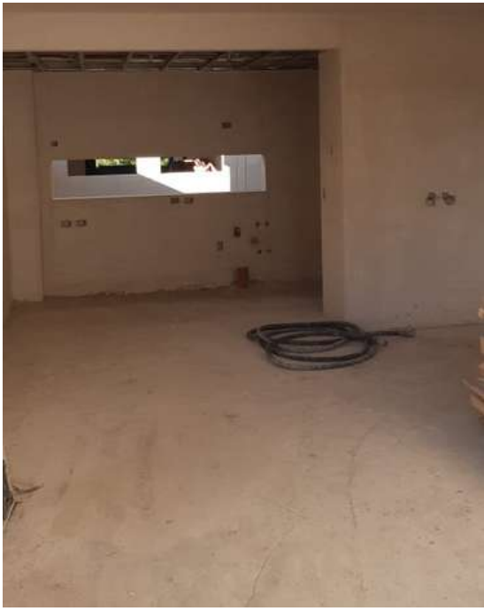
Yesería - Durlock