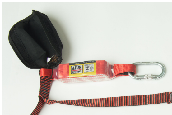
Absorvedor de energia