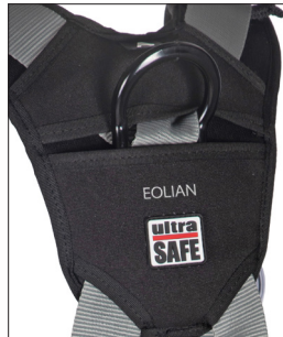
Espaldar com bolso