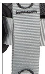
Fitas em poliéster