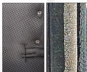
Espuma pré-moldada em 3 camadas