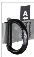
Anéis D em alumínio