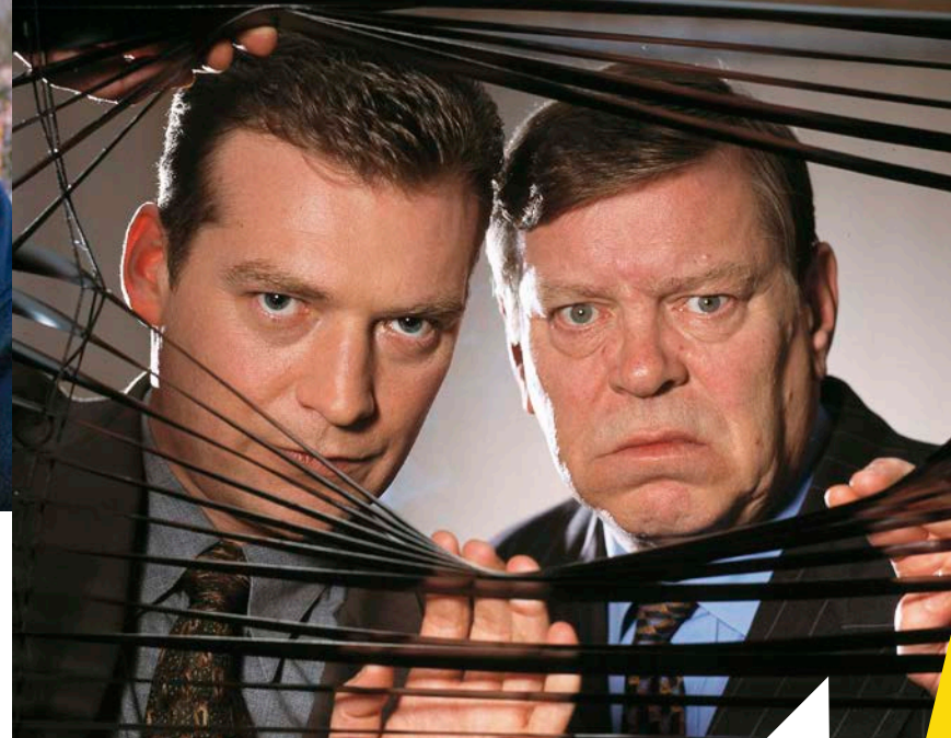
Detectives Dalziel en Pascoe.

Ook bij ons een van de grootste tv-hits van de jaren 70: De Onedin Lijn.