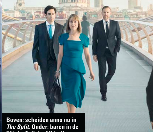
Boven: scheiden anno nu in The Split . Onder: baren in de 50's in Call the Midwife .