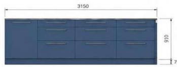
Ansicht Unterschränke M 1:25