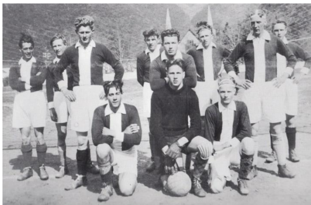
Eldste bilete av fotball-laget - teke i 1938 på gamle fotballbana med kyrkja i bakgrunnen.

Det var nok ulike Idrettsaktivitetar i Lærdal før skipinga av Lærdal Fotballklubb. Mellom anna kjenner ein til at det var skipa til skiaktivitetar i Sluppen på 30-talet. I boka "Skiidrett i Sogn og Fj" - er det ei resultatlista frå eit slikt renn i Lærdal. Vidare veit ein at det var turngrupper i aktivitet. Fotballaktiviteten kom i gang på 30-talet og laget vart skipa i 1937 med fotball som aktivitet.