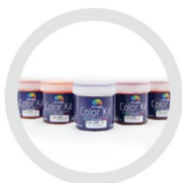
Kit de culori