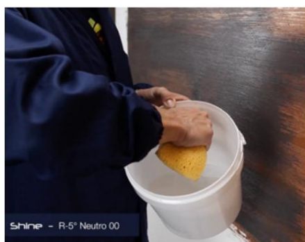
Strălucire (Spălare cu apă)