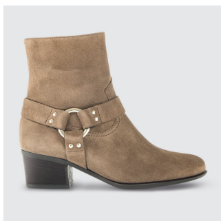
DAMEN | STIEFELETTE Veloursleder CHF 160.-