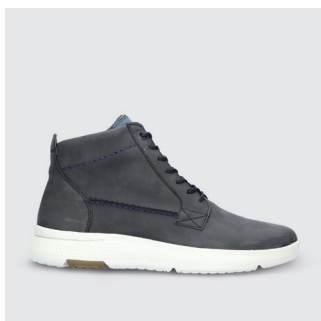
HERREN | SCHNÜRBOOT Fettnubukleder CHF 185.-