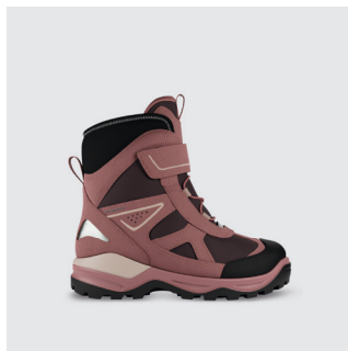
KINDER | WINTERBOOT Leder / Textil, GTX Futter CHF 140.-