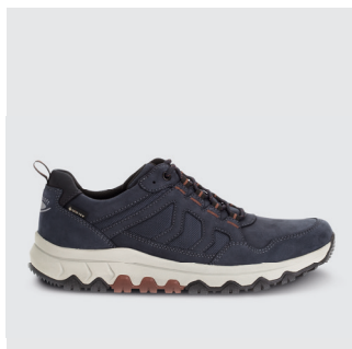
HERREN | SNEAKER / ROLLING SOFT Leder / Textil, GTX Futter CHF 200.-