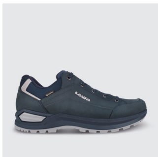
HERREN | MULTIFUNKTIONSSCHUH Nubukleder, GTX Futter CHF 220.-