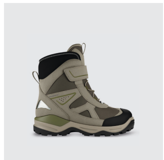
KINDER | WINTERBOOT Leder / Textil, GTX Futter CHF 140.-