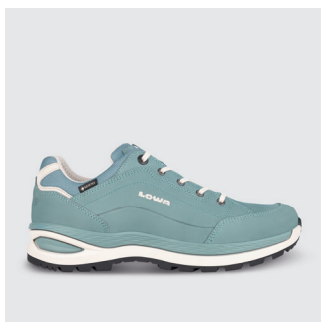
DAMEN | MULTIFUNKTIONSSCHUH Nubukleder, GTX Futter CHF 220.-