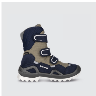
KINDER | WINTERBOOT Leder / Textil, GTX Futter ab CHF 129.-