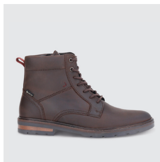
HERREN | BOOT Nubukleder, GTX Futter CHF 200.-