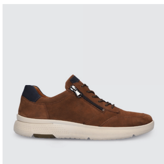
HERREN | SNEAKER Nubukleder CHF 170.-