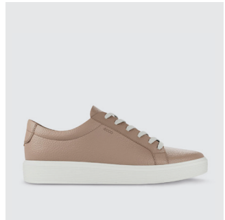
DAMEN | SNEAKER Glattleder CHF 180.-