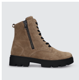
DAMEN | STIEFELETTE Veloursleder CHF 190.-