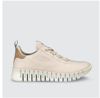
DAMEN | SNEAKER Glattleder CHF 170.-