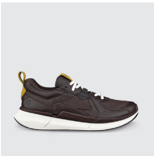
HERREN | SNEAKER Leder / Textil, GTX Futter CHF 190.-