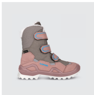
KINDER | WINTERBOOT Leder / Textil, GTX Futter ab CHF 129.-