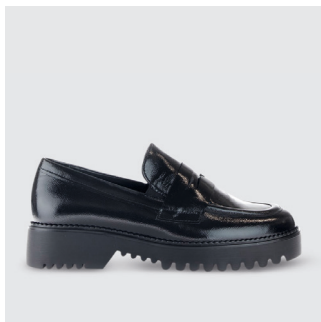
DAMEN | LOAFER Lackleder CHF 150.-