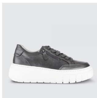
DAMEN | SNEAKER Glattleder CHF 150.-