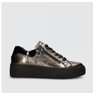
DAMEN | SNEAKER Knautschlack CHF 165.-