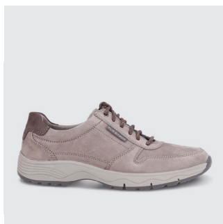
HERREN | SNEAKER Nubukleder CHF 150.-