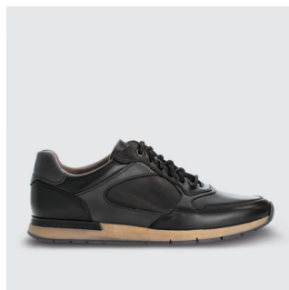
HERREN | SNEAKER Glattleder CHF 160.-