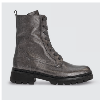
DAMEN | SCHNÜRSTIEFELETTE Nappaleder CHF 180.-