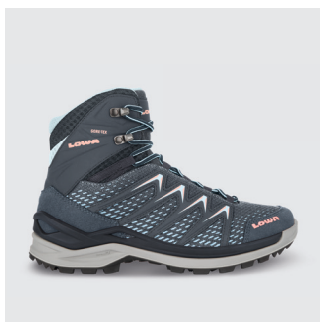
DAMEN | TREKKING Leder / Textil, GTX Futter CHF 220.-