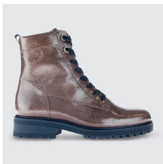
DAMEN | SCHNÜRSTIEFELETTE Lackleder CHF 160.-