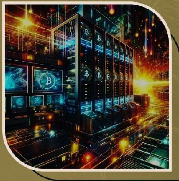
Mineração de Bitcoin