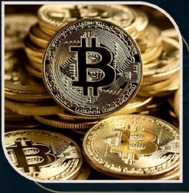
Mineração de Bitcoin