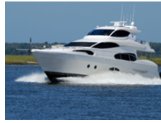
Yat, Yelkenli ve Gemiler