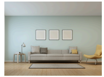
Bekleme Alanları, Oteller