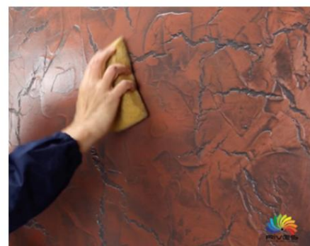
Strălucire (spălare cu apă)