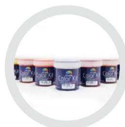
Kit de culori