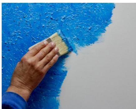
Primul strat codul periei 1017