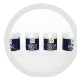
AS 100 - AG 200