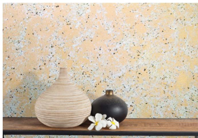
Nubilia M Culoare Duală - Auriu