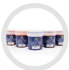
Kit de culori