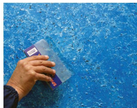
Al doilea strat cu spatulă specială cu lamă dublă cod 1016