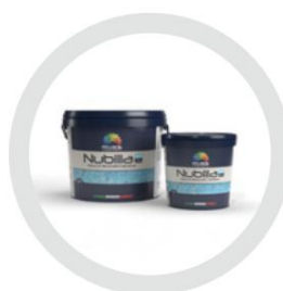
Nubilia M Dual Color