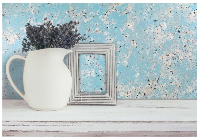
Nubilia M Dual Color - Argintiu