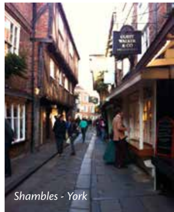
Shambles - York