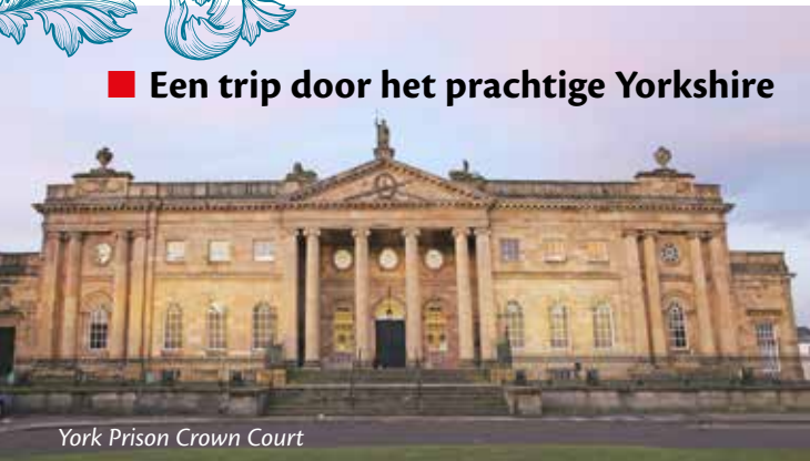
York Prison Crown Court