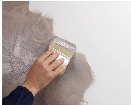
Kalahari mediu/mic Efect încrucișat