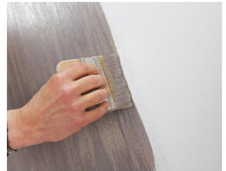
Kalahari mediu/mic Efect diagonal