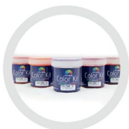
Kit de culori