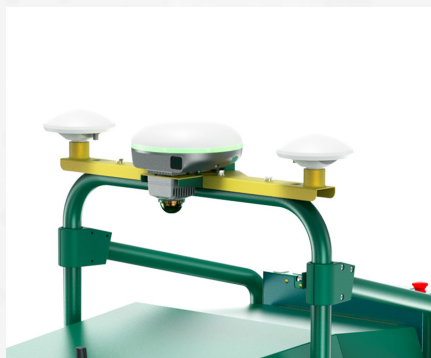
3D-LIDAR & RTK-GNSS KARTIERUNG & PRÄZISION