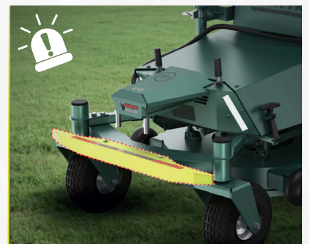
STOSSFÄNGER & DIEBSTAHL-ALARM