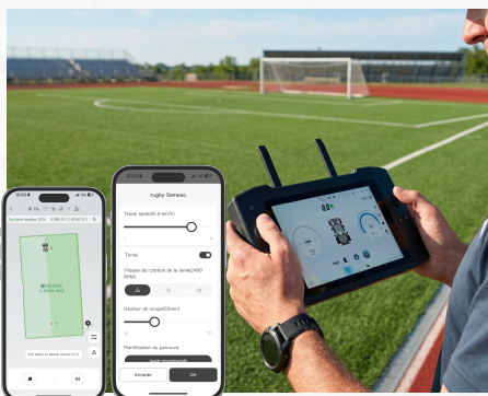
FERNSTEUERUNG & KONTROLLE AUF DISTANZ