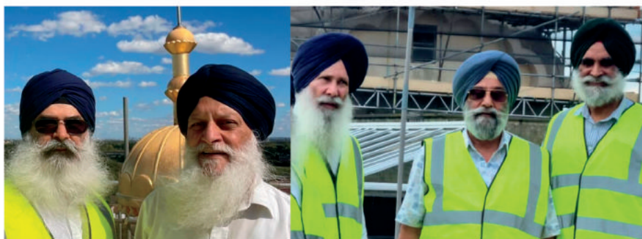
Sevadars overseeing the works