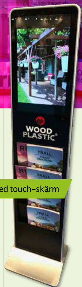
Även med touch-skärm

IBLAND HAR BROSCYRSTÄLL en tendens att se ganska tråkiga ut. Men så behöver det inte vara. Det digitala broschyrstället innebär att det är möjligt att marknadsföra broschyren med hjälp av dess innehåll. Det digitala broschyrstället har en skärm som är mellan 21 och 72 tum. Finns både med och utan touch-skärm.