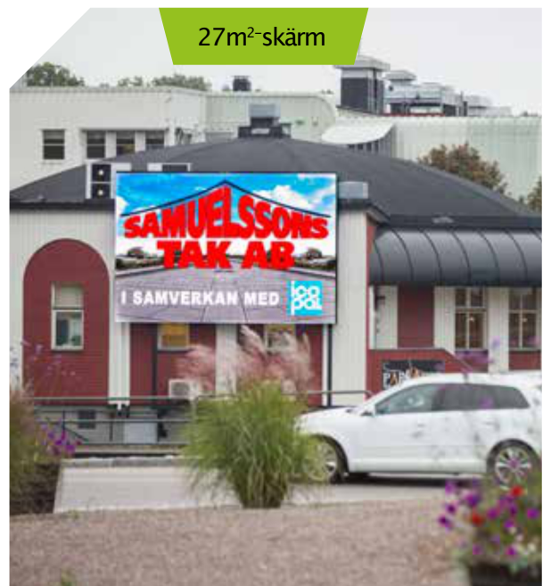
27m 2 -skärm

VIRIBA LEVERERAR NYCKELFÄRDIGA lösningar där allt från skyltbärare, fundament, installation och elförsörjning ingår. Men den enskilde kunden kan naturligtvis stå för allt förarbete medan Viriba bara ser till att själva installationen utförs med största möjliga kvalitet.