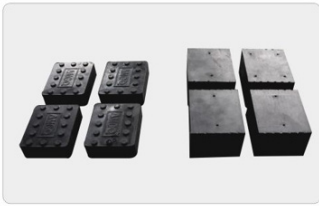
Mukana vakiona 38 mm ja 70 mm kumityynyt