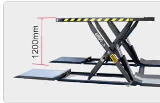
Suurin nostokorkeus 1200 mm, nostoaika 30 s