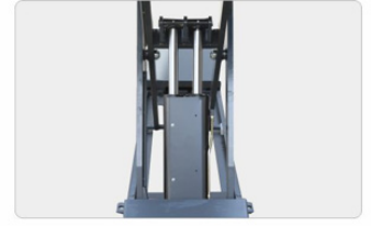
Kaksinkertainen hydraulinen synkronointi ja hydraulinen lukitusjärjestelmä