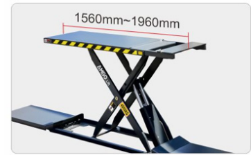
Jatkettavat tasot 1560 mm – 1960 mm