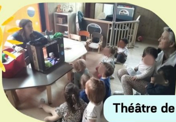
Théâtre de Marionnettes