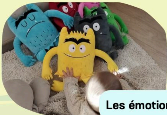
Les émotions en couleurs