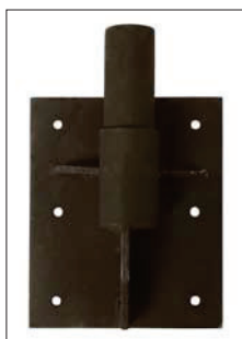
Suportes para piso e parede vendidos separadamente