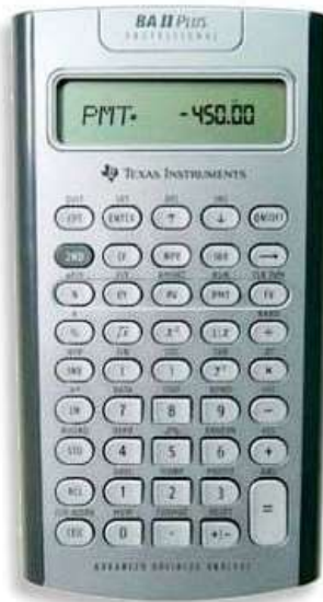
TI BAII Plus Professional