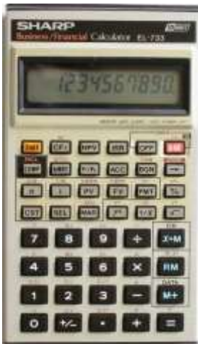
Calculadora de Negócios/Finanças Sharp EL-733