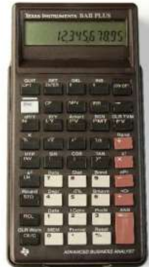
TI BA II Plus (Analista de