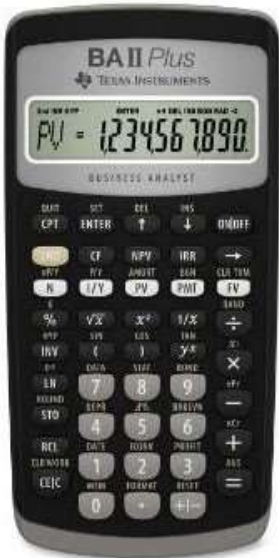
TI BAII Plus Negócios)