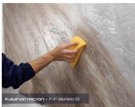
Spălați cu apă