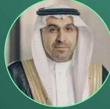
معالي المهندس عبدالله العبد الكريم رئيس الهيئة السعودية للمياه